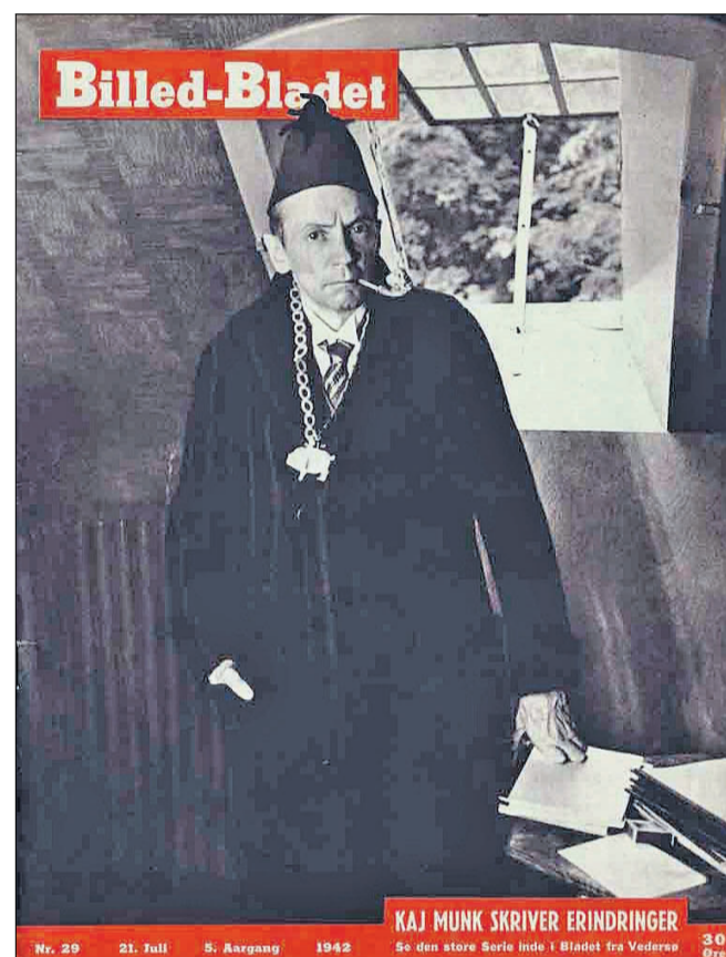
Kaj Munk på forsiden af Billed-Bladet.