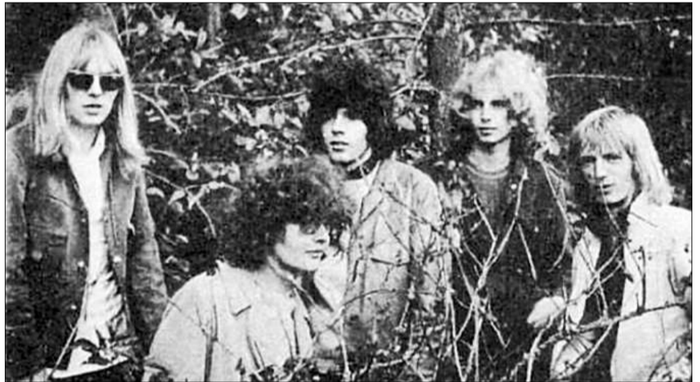
Gruppen High Lites vandt i 1969 semifinalen om det officielle jyske Beat- og Soulmesterskab.

Senere flyttede familien til Østerbro, hvor han fik sin opvækst som baggårds-puma på den københavnske stenbro. Det er ikke kendt af mange, at Otto Brandenburg er født i landsbyen, og Lokalrådet i Hejnsvig har således arbejdet med planer om at rejse en statue til minde om det berømte bysbarn.