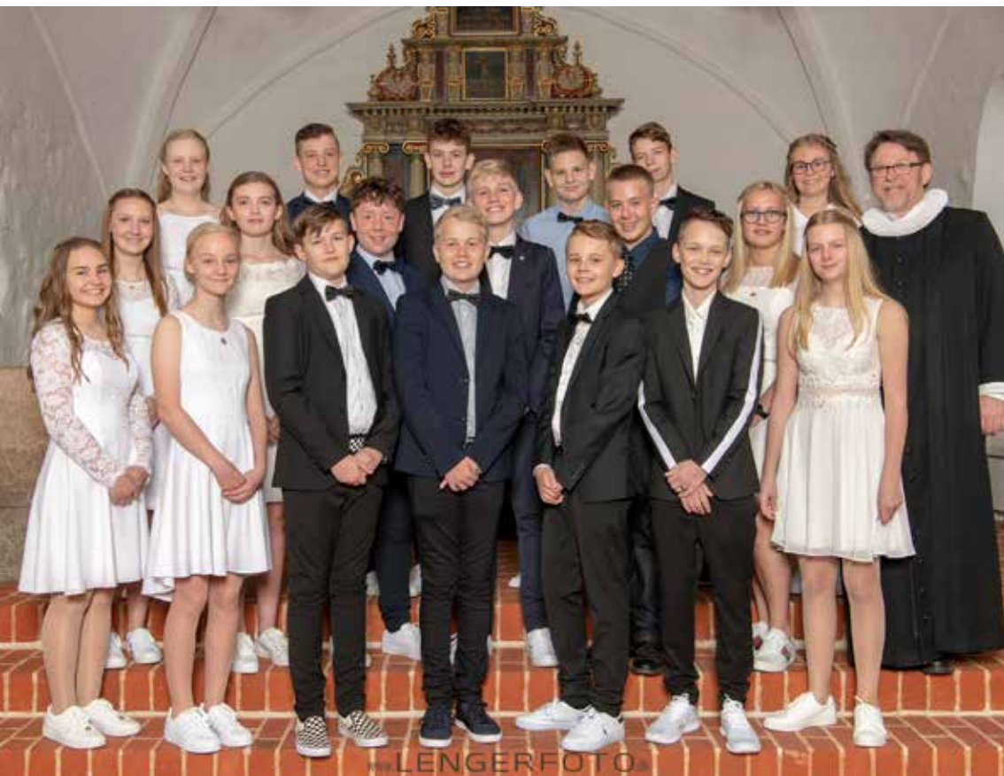
Hejnsvig Kirke 28. april 2019